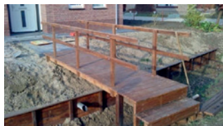
2) Brug over beekloop