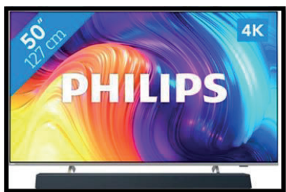
1) TV's entertainment

De belevingshoeken willen we inrichten met de volgende elementen: