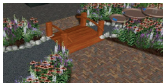
3) Beekloop maken en keien in beekloop aanbrengen