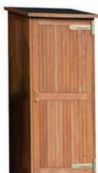
9) Tuin deco tuinkast

De Qwiek.melody is speciaal ontwikkeld om bewoners op speelse wijze te stimuleren meer te bewegen. Zodra de Qwiek.melody beweging waarneemt, speelt deze muziek af. De Qwiek.melody is een ideaal product om interventies door fysio- of ergotherapeuten te ondersteunen. Met keuze uit 60 liedjes én de optie om een eigen afspeellijst te maken, kan de inzet van de Qwiek.melody eenvoudig afgestemd worden op de interesses van de bewoners.